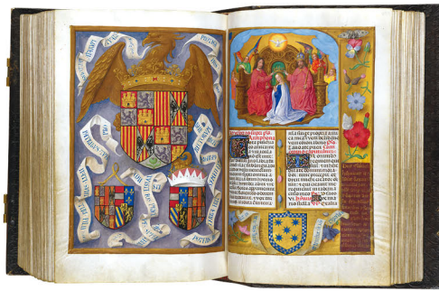
Detalle del Breviario de Isabel La Católica, que la editorial publicará en breve رسم لأحد التفاصيل من كتاب الادعية ليزابيل الكاثوليكية الذي يصدر قريباً عن دار النشر Detail of the "Breviario de Isabel La Católica", which will be published shortly. Détail du "Breviario de Isabel La Católica," que la société éditoriale publiquera en bref